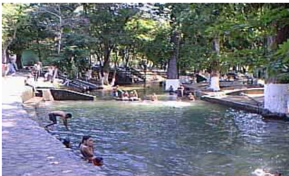
Figura 12: Balneario de la Quebrada de Araure

Cuenta con una extensa área boscosa con árboles con más de 20 metros de altura. Es visitado hoy día sólo en época de Carnaval y Semana Santa, pues por falta de vigilancia policial y por el deterioro de sus instalaciones no es un lugar seguro para el disfrute en familia. (Fig.4)