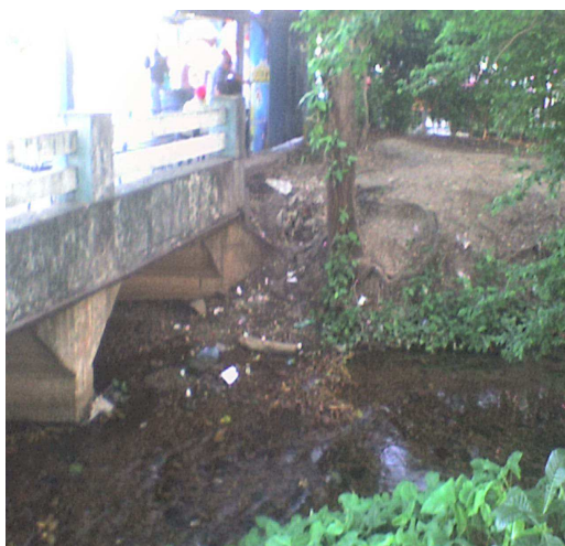
Figura 1: Residuos sólidos. Sector Avda. Las Lágrimas. Puente Araure (Contaminación Ambiental).

De igual manera, es importante resaltar el hecho que esta quebrada es un recurso natural para ser explotado desde el punto de vista del turismo ecológico, por cuanto se debe aprovechar su trayectoria en los Municipio Araure y Páez, que en la actualidad son utilizados para el lavado de carros y como vertedero de basura (desde la Calle 5 de Araure, conocido como barrio El Estanque, Avda. Las Lágrimas, Avda. 5 de Diciembre, Barrio Capuchino de Acarigua y zonas aledañas al Terminal de Pasajeros y Parque Musiu Carmelo), lo que origina que su rivera fuera del balneario sea un foco de contaminación y enfermedades para niños y adolescentes que las utilizan como un lugar de esparcimiento.