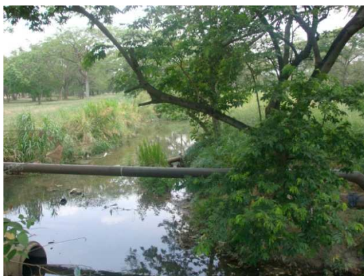
Figura 5. Aspecto de La Quebrada de Araure en lo predios del Parque Musiú Carmelo. Municipio Páez.

En virtud de lo anterior, esta propuesta surge como estrategia de divulgación de la importancia del rescate de la Quebrada de Araure, que no sólo es un sentir del pueblo araureño, sino de ambos municipios, pues el cauce natural de este reservorio pasa por ambas ciudades (Araure-Acarigua).