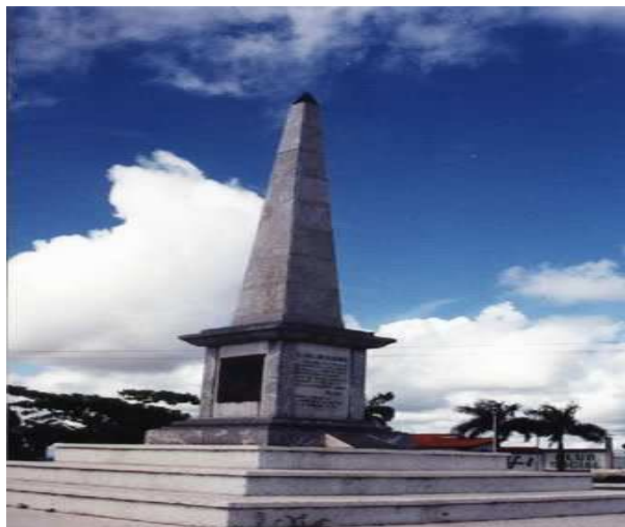
Figura 11. Monumento Conmemorativo de la Batalla de Araure “El Túmulo”