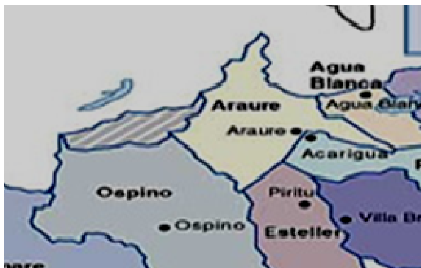
Figura 8: Municipio Araure.

El Municipio Araure se encuentra en los Llanos Altos, en la parte norte del municipio es donde termina el piedemonte andino, área dominada por el Páramo El Rosario alcanzando los 1.555 msnm. En la mayor parte del municipio se presenta la vegetación de Bosque Tropical con una temperatura promedio anual de 24,5°C alcanzando temperaturas máximas de 27°C, y una precipitación media anual 1722 mm. (ob. cit.)