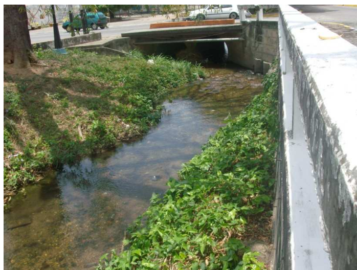
Figura. 7. Quebrada de Araure. Av. Chollett Araure. Intercepción entrada a la Urb. El Pilar. Municipio Araure.