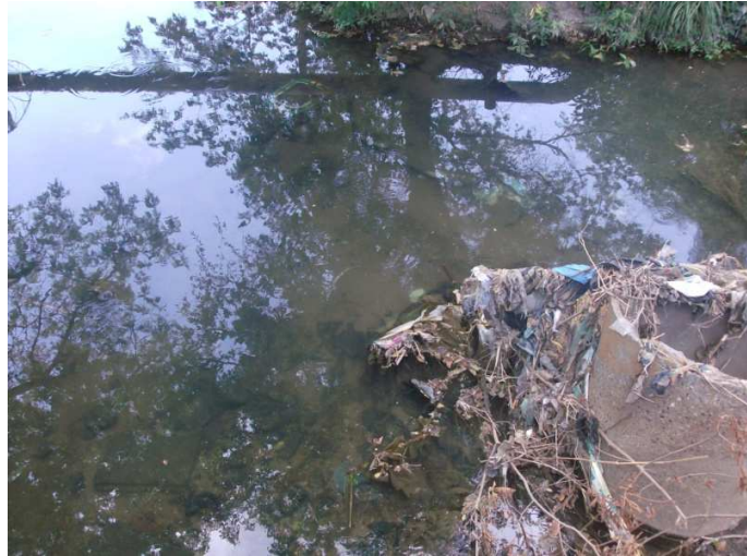
Figura 4. Daño Ambiental de la Quebrada de Araure. a la altura de la Av. Páez. (Municipio Páez).