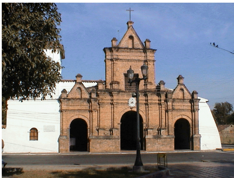
Figura 10. Iglesia Ntra. Sra. Del Pilar

templos en el país, a saber San Sebastián de los Reyes en el Edo. Aragua y San Francisco de Yare en el Edo. Miranda. Por otro lado es la única iglesia colonial de Venezuela que le fue construido el coro independientemente de las puertas de entrada del templo. En ella fue bautizado el Gral. José Antonio Páez y según la tradición, en 1813, entró a orar en su recinto. El Libertador Simón Bolívar antes del triunfo de la Batalla de Araure. En 1955 el templo fue declarado Monumento Nacional.