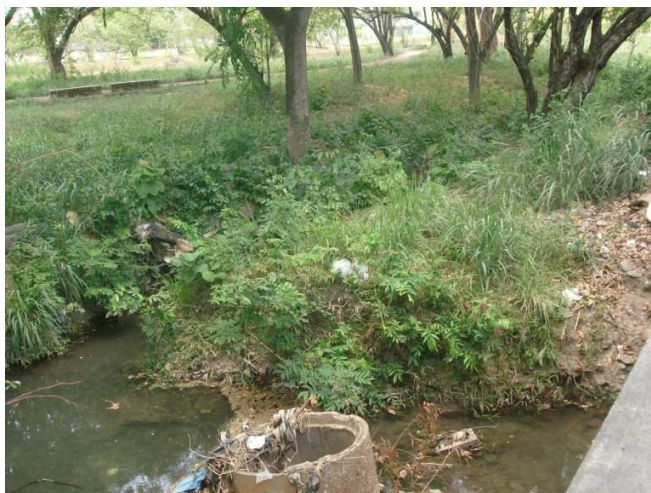
Figura 6. Quebrada de Araure. Altura de la Av. Páez Al fondo se aprecia el Parque Musiú Carmelo. Municipio Páez-Acarigua jom download segera berbagai kumpulan buku gratis Ilmu Komputer dan Bisnis di >> http://bukugerais.4shared.com <<

De allí la importancia de hacer ver al colectivo de las ciudades gemelas, incluyendo sus autoridades, que no se está preservando un patrimonio araureño, sino que se está salvando el agua, líquido vital que en poco tiempo escaseará este regalo de la naturaleza.