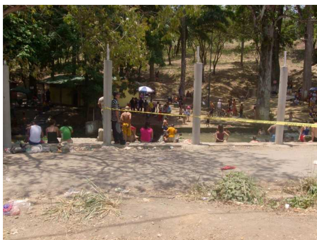
Figura 3. Quebrada de Araure. Semana Santa (2009).

El ecosistema de la Quebrada de Araure presenta en la actualidad un deterioro ambiental que de no tomarse acciones correctas que involucren los entes gubernamentales, municipales, educativos y el colectivo en general se perderá irremediablemente.